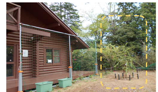
ターザンロープ跡地にしだれ桜を植えて頂きました。