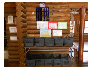
荷物はカゴに入れてね。