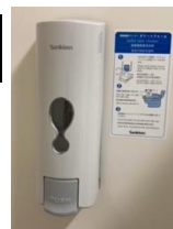
便座除菌クリーナー

ご利用者の皆様からのご要望を受けまして、男女トイレに便座除菌クリーナーを、料理室入口に、靴を履き替えるときにお座りいただく椅子と、マットを設置しました。電子ピアノも購入しましたので、どうぞご利用ください。