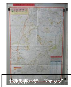
土砂災害ハザードマップ