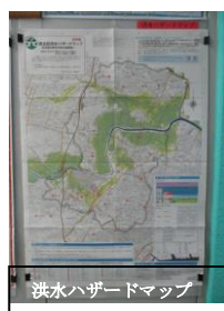
洪水ハザードマップ