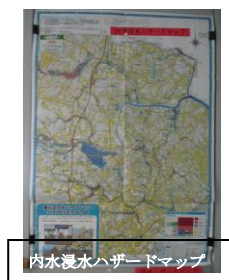
内水浸水ハザードマップ