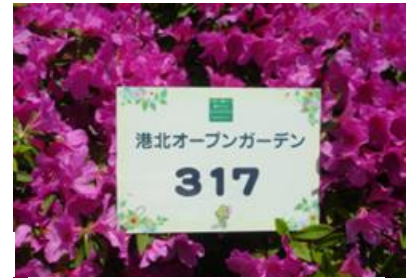
ツツジと新田地区センターナンバー